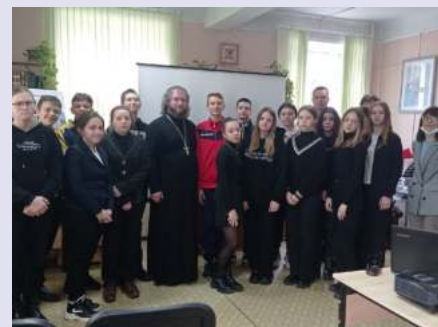
Обучающиеся 8Б класса