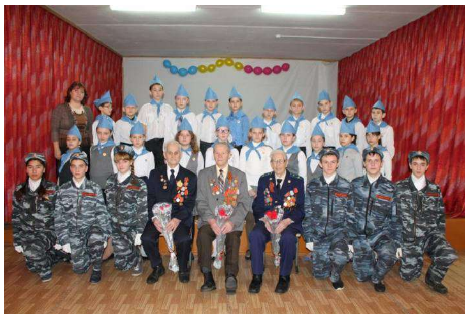
Нерывная связь поколений

Отечественной войны, пятиклассники гордились своим новым званием "Юные Жуковцы".