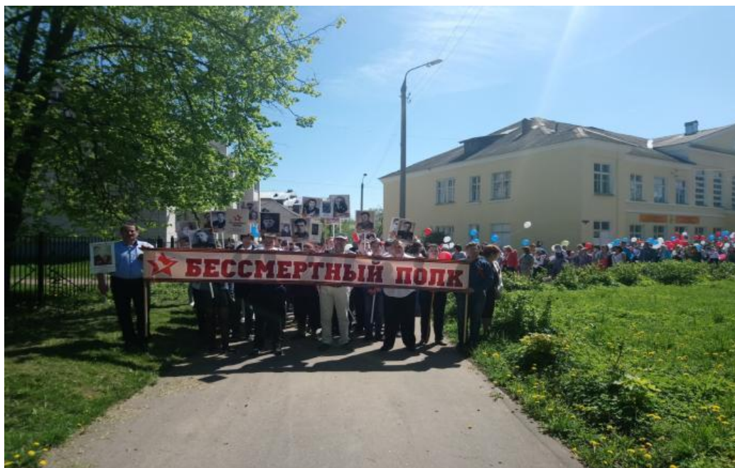
Начало шествия от школы

Ежегодно, по инициативе совета музея педагоги и школьники принимают самое активное участие в акции «Бессмертный полк» под девизом: «Они должны идти победным строем в любые времена». «Бессмертный полк» — международное общественное движение по сохранению личной памяти о поколении Великой Отечественной войны. Главная цель акции — сохранить связь поколений и память о наших предках — ветеранах, фронтовиках, участниках Великой Отечественной войны, тружениках тыла. С каждым годом увеличивается количество участников данной акции. В одном строю идут ветераны, фронтовики, курсанты Почетного караула «Пост №1», «Юнармейцы», «Жуковцы», наследники Великой Победы. Эта акция демонстрирует, что нынешнее поколение приняло эстафету Памяти и передает её будущему поколению, чтобы люди помнили о Великой Отечественной войне. У каждого участника акции своя фотография, шествуя в колонне Бессмертного полка, оживают страницы из Книги Памяти. Воины, защитники земли русской, победившие фашизм, навсегда останутся в строю Бессмертного полка.