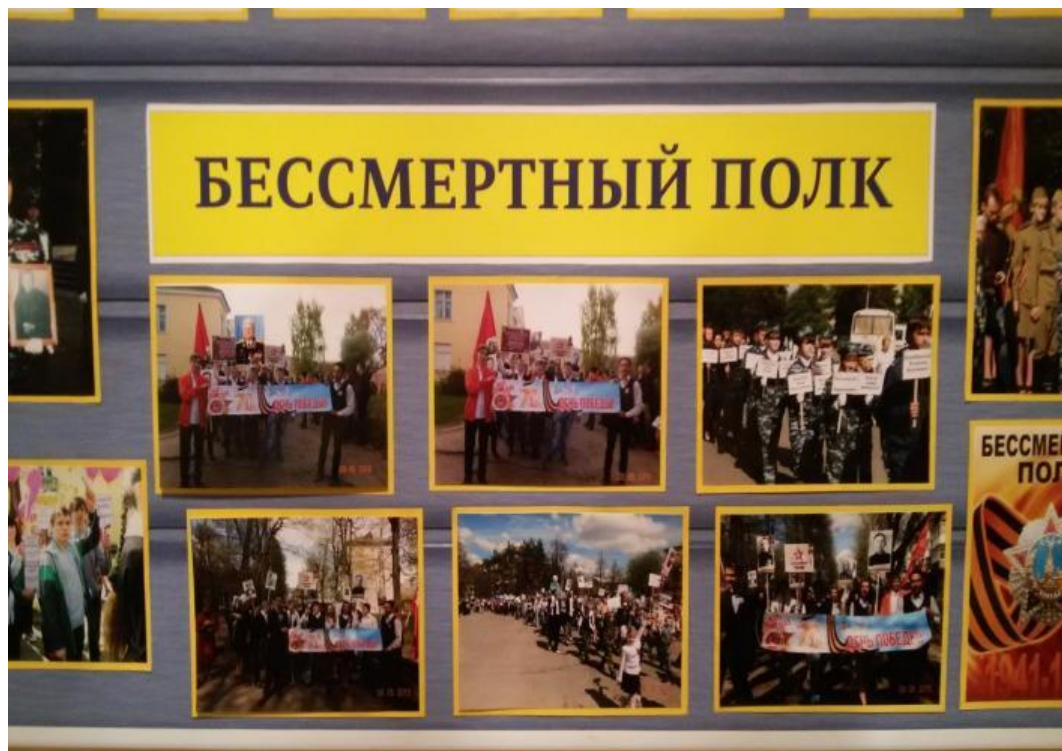
Фото из школьного музея